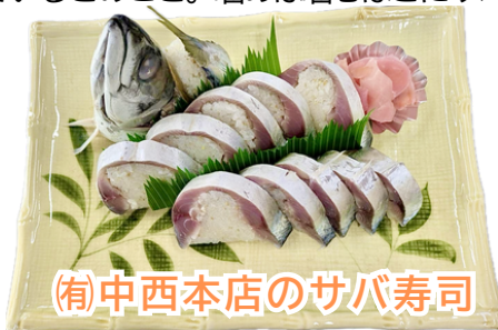
(有)中西本店のサバ寿司

中西本店さんといえば、高知の定番、皿鉢料理をはじめとする美味しい料理が有名ですが、特におススメなのが「サバ寿司」です！目を引くのは、サバの頭が添えられたインパクト抜群のビジュアル。盛り付けも美しく、特別な日にもぴったり。いざ食べてみると見た目の豪快さに反し、西土佐産の柚子が効いていて非常にさっぱり。酢を控えめにしまろやかに仕上げているとのこと。噛めば噛むほどにサバ本来の旨みを感じられます。これはお酒がすすむ！もし翌日になっても、少し炙ればまた別の美味しさに。特に頭の部分を炙ると絶品です！最近サバの入荷が難しく貴重な一品のようなのですが、みなさんも見かけたらぜひ食べてみてください。